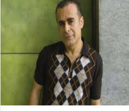
شایانی باسه که له‌وه‌ی فستیقاله‌دا که له‌ چه‌ند به‌شی جیاوازا ده‌ریوه‌ چوو، ۱۷۹ فیلم له‌ سینمه‌کارانی ۴۲ ولاتی جیهان پێشان دران.