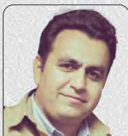
ئەلبۆرز روئین تەن

دوای ئەوەی شۆرشێ زۆرێ ئازادی له کوردستان لەو پەڕی گەورەیی و شکۆدا بەرپۆه دەچوو، و بە تاییه‌تی له کوردستان داواکان هەر زوو له دژایه‌تی پۆلیسی ئەخلاقه‌وه بۆ دژایه‌تی ته‌واوی رێژیم گۆرابوون؛ ته‌نانه‌ت شۆرش به ره‌نگی ناسیۆنالیستی و نیوه‌رۆکی کوردایه‌تی به‌رده‌وام بوو؛ هەر ئەوکات دهنگۆی ئەوه