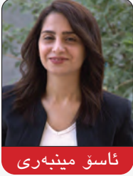
ئاسق مینه بری

بیگومان به ره نکار بوونه وه له گهل پڕیژیم هه ر جار وه له سه نگه ریکدا ده کرئ و ئه وه ی که گوړانی به سه ردا نایه ت، رق و تووره یی خه لک له ده سه لات و بیزارییان له سته م و ناداپه ره ربیه.