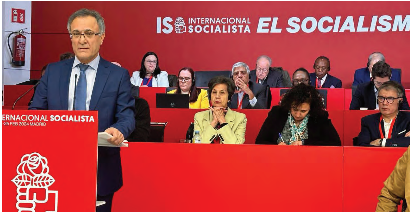
دهقی وتاری وته‌بێژی حیزبی دیموکراتی کوردستانی ئێران له کۆبوونه‌وه‌ی ریکخراوی ئینترناسیۆنال سۆسیالیست که رۆژانی ۵ و ۶ی رەشەمە له مادریدی پێته‌ختی ئیسپانیا به‌رپۆه‌ جوو.

چاو ترسنیکردنی خه‌لک و زالکردنی که‌شی ترس و توقاندن ته‌نیا له ماوه‌ی یه‌ک سالی رابردوودا نزیکیک به ۹۰۰ که‌سیان ئیعدام کرد که به‌شیکیان دهبه‌سه‌رکراوانی جوولانه‌وه‌ی ژن، ژیان، ئازادی بوون.