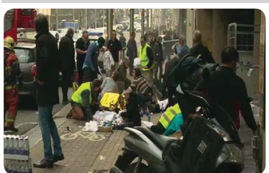
گرووپی داعش بەرپرسايەتيی پەلامارەكانی شاری پاريسيشی وہ ئەستۆ گرتبوو که ۱۳۰ کوژراو و برینداری لن کهوتبووه. ئهم هیرشانه و هیرشهکانی برووکسیل به گەورەترىن پەلامارە تۆرۆرىسىتىيەكانى مۆژووى فەرانسە و بىلژىك دادەنرىن.

دوابهدوای روودانمی ئهو ۳ تهقینهوهیه گرووپی داعش به بلاوکردنهوهی بەياننامەيەك بەرپرسايەتىي ئەم ھىرشانەي وە ئەستۆ گرت.