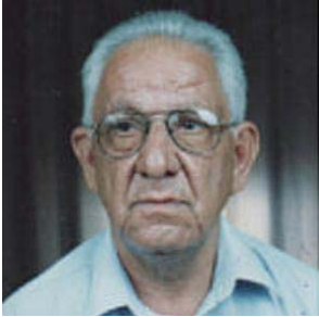
ته‌مه‌نی ٦٦ سالیدا و له‌ نه‌خۆشخانه‌ی کوماری له‌ شاری هه‌ولێر کوچی دوابی کرد.

هه‌یه‌تیه‌تیکێ حیزبی دیموکراتی کوردستان به‌شداریی له‌ ریه‌ره‌سه‌می پرسه‌ و سه‌ره‌خۆشیی مه‌حمود زامداردا کرد. دوا‌یوه‌رو‌ی روژی هه‌ینی، ١٨ ی خه‌رماتی هه‌یه‌تیه‌تیکێ حیزبی دیموکراتی کوردستان پێکها‌تو له‌ به‌ریزان ماموستا عه‌بدوللا حه‌سه‌نزاده، که‌سایه‌تی سیاسیی کورد و که‌مال که‌رمی و قادر وریا، نه‌دانی ده‌فته‌ری سیاسیی حیزب و برام زیویه‌یی، به‌پرسی پێوه‌ندییه‌کانی حیزبی دیموکراتی کوردستان له‌ هه‌ولێر به‌شداریان له‌ پرسه‌ و سه‌ره‌خۆشیی مه‌حمود زامدار، نووسه‌ری ناوداری کورد کرد و په‌یامی ماته‌مینی حیزبی دیموکراتی کوردستانیان به‌ کومه‌لگای رووناکبیری کوردستان و بنه‌ماله‌ و که‌سوکاری ناو‌راو راگه‌یاندا. جێی وه‌بیریه‌تانه‌یه‌که‌ مه‌حمود زامدار، نووسه‌ر ناوداری کورد روژی پێنجه‌مه‌، ١٧ ی خه‌رماتی