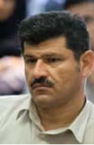
به‌همن نه‌حمه‌دی نه‌موویی

له‌ ریزی ئه‌وه‌ ٤٤ که‌سه‌ دا که‌ ریکخراوی چاوه‌دیری مافی مرۆف له‌ سه‌رجه‌م ٢٣ ولاتی جیهان به‌ شایانی پێدانی خه‌لاتی سالانه‌ی خۆی (خه‌لاتی هلمن همت) ی زانیون، ٤ چالاکی مافی مرۆف له‌ ئێراندا به‌رچاو ده‌کون که‌