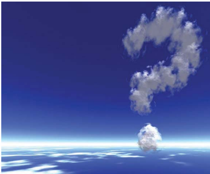
ئێران و کوردستان به دور به روانگه و کارکردی به دهنه له خویندنه وهی ناستهکی و پیشش ناتوانین بهم خاله گریگه نه وه له حالیکه یه

نویی له سهر بنه مای لیزانی و دهروهستی له پیتا ریکهانی بزوتنه وه یه کی به زری سیاسی - کومه لایه تیی به دور لهو خویندنه وه یه پیشتر لئی ده کرا هه بی و به تیگه یشتن له واقعیاتی ده ره ست و به رههستی دروستی کومه لگه ی