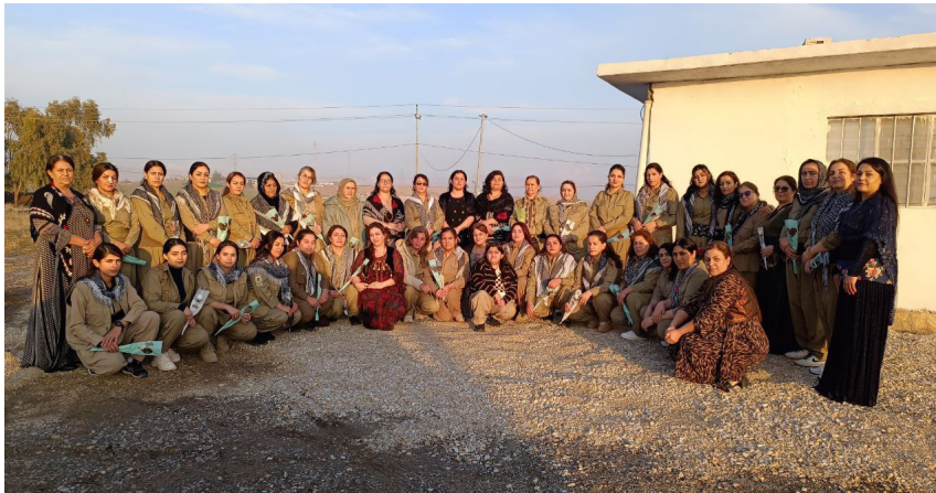
پیشکه شکردنی شاخه گۆل به بۆنهى ٢٦ى سه رماوه ز روژی پیشمه رگه به ژنانی پیشمه رگه