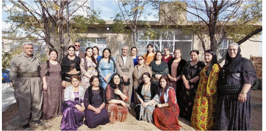
به کهم دیداری ههینتی حیزی دیموکراتی کوردستانی ئێران به مهبهستی پیروزبایی کۆنگرەى ڤی ژنان