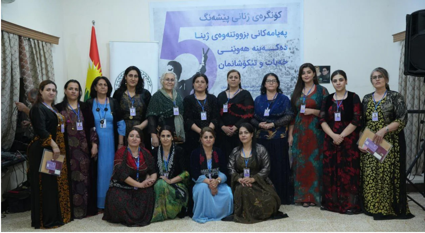
کۆتایی کۆنگرەى ڤی بهکیهتی ژنانی دیموکراتی کوردستانی ئێران