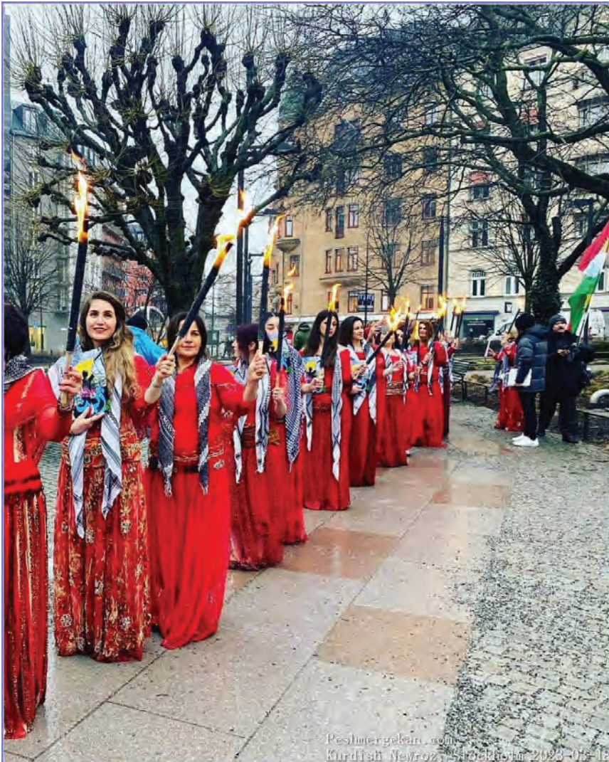
Postimgrekan.com Kurdish Newroz 2023-03-18