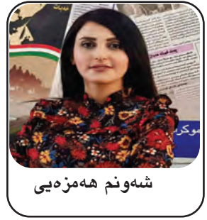
شهوان هه مزهیی