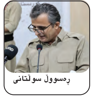
په سوول سولتانی