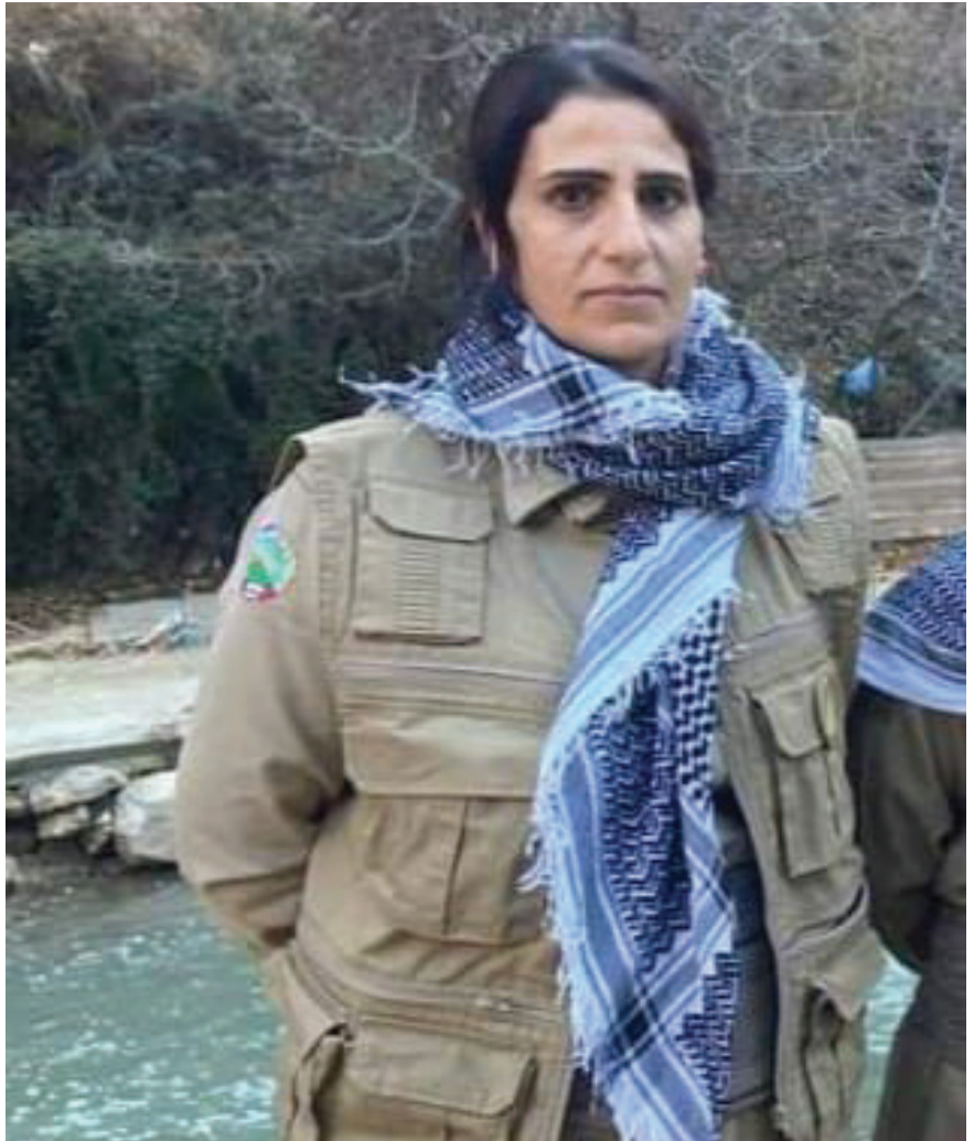
که پیویسته و بویم لوابی کارم کردوه.

پیشمههرگه بوون و دایکایه تی ئه رکیکی سه خته به لام پیروژترین