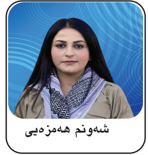
شهونم هه مزهیی