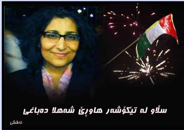
سلاو له تیځوشر هاورئ شهلا دباغی