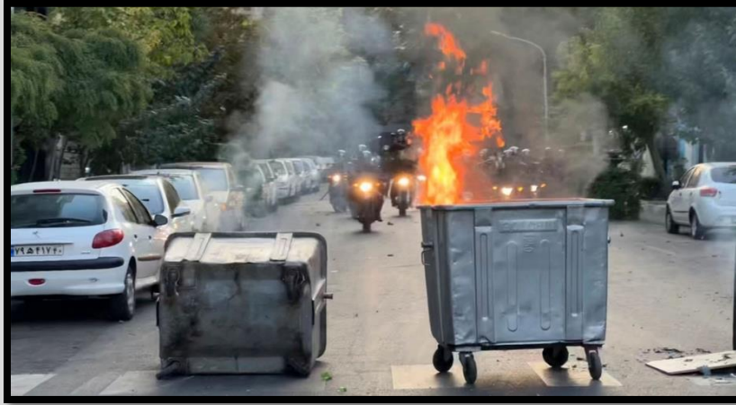
نيرېكا چنوت

نمازې: نهو دهقه وهرگيراني لاپهړه كاني ۵۷-۵۸ و ههروهه ۷۸ هه تا ۸۰ كتيبې "خوړاگرې مېدهنى: نهوهى ههمووان دهې بيزانن"، نووسېنى نيرېكا چنوت، ماموستاى مافى مروؤف و كاروبارى نيوډهولته تى له زانكوى هاروارده. نه م كتيبې سالى ۲۰۲۱ چاپ و بلاو بوتهوه.