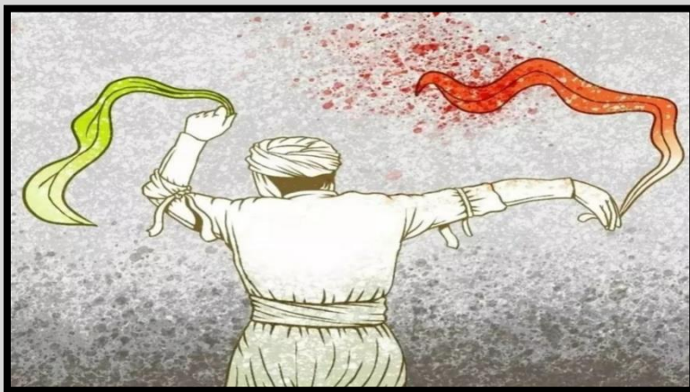
باوان كرمانشانى - و نه فارسىپهوه: كاروان ميراوى

شورشى ژينا نه و راستيپهى بو هموو لايهك ناشكرا كردووه كه كومهنگه كوردستان هم له بواري ريځستن و همژى له بواري ناستى تيگهيشتوويى و وشياريى سياسيپهوه له ناوچهكانى ترى ئيران زور له پيشتره، نهمهش يهكيك نهو فاكتهرانهپه كه له ماوهى چند مانگى رابردوودا كوردستانى له هرېم و ناوچهكانى ديكهى ئيران جيا كردوتهوه. دهبيت نهوش بوتريت كه كوردستان خاوهنى رابردوويهكى پرئهزمونى چالاكى بهربلاو و گشتگيري سياسى و هروهها خاوهنى ويژمانى بههيزى خويهتى كه گرینگترين هوكارى نهمهش بو هبوونى حيزبه ميژوويى و ريشهداره جهماوهريپهكان دهگهريتهوه.