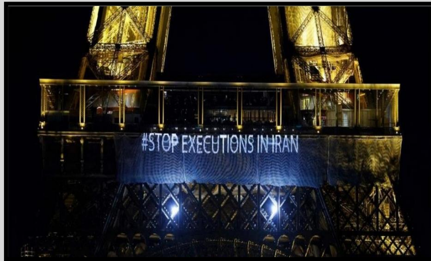
و: كه مان هه سه ن پوور

سائى نوئ له نيران وهك چوئن نهوهى پيشوو كوئايى هات، دهستى پى كرد: به ئىعدام. ۲۰۲۳ قه راره له ۲۰۲۲ دهه نه نجامانه تر بى، كه هه ر ئىستا بناغهى كوئارى ئىسلامى هيناوه ته هه ژان. كاتى نهوه هاتووو نوروپا له وه لامدا رهوتى خوئ بگوئى.