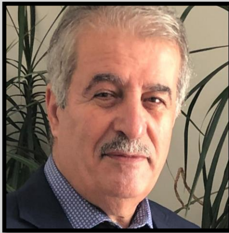
هاشم رۆسته می

بو نه وه ی به وردی بزانین كه شۆرشى ژن، ژيان، نازادى كه به دواى كوشتنى ژینا (مهسا) نه مینی دهستی پى كردوه، هۆكاره كانى چین، ییویسته ئاورپك وه رابردوو بدینه وه. دیاره نه وه راسته كه مه رگی ژینا نه مینی كچه كوردی خه لكی شاری سه قز كه له تارانى پایته ختى ئیران به دهستی هیزه كانى گه شتى ئیرشاد دهستگیر كرا و دواتر له ژیر شكه نجه دا كوشتیان، بوو به هوى هه وینى نه م راپه رین و شۆرشه، به لام له راستیدا نه وه ته قینه وه ی ناره زایه تی په نگخواردوو دهیان سانه بوو كه گه لانی ئیران له دهست نه و رینژیمه له سینگی خویاندا رایان گرتبوو و رۆژ به رۆژیش زیاتر قورسایى له سه ر ده كردن.