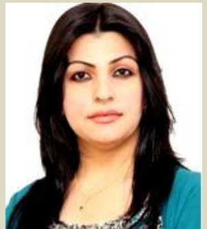
كارتىكردى خۇبان ھەيە؟

بالادەستى پىۋا و دىن پىكەۋە بەستراۋەتەۋە، من تا سەر ئىستقان ھەر دەسلەتى رەتدەكەمەۋە كە بىيۋىن مافى نەۋانى دىكە زەۋت بىكا.