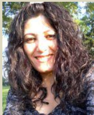
شه ری ټیبه دین له گه لن دابونه ریت و دین و دسه لاته بی، نه و چاکترین ریکایه یو یه کسانیی کردنی ټران و پیاوړی.

پایزه نه حمده: نایه خودی پیکهاته ی سروشی پیاو وک ره گزی تیر پیاوړی به و جوړه نافه ریده دکا؟ یان نه و دابونه ریت و دین و دسه لاته پیاوړی به و شیویه بهر همد دهینن که هه، یان هه روو هؤکار هه ر یه که و به