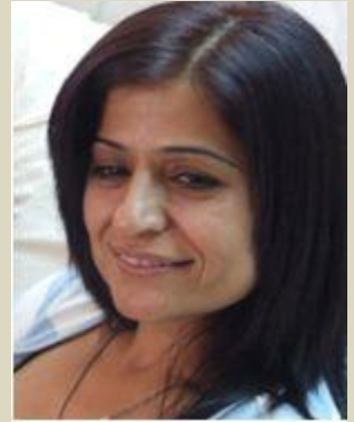
جوربک کارتیکردنی خوځيان هه يه؟

دهسلات خوځی هؤکاري سهرهکين نهو کوشت و کوشتاريه . پنويسته شورشیکي ژنان به ناقاري بهکسانين هه لنگيرس .