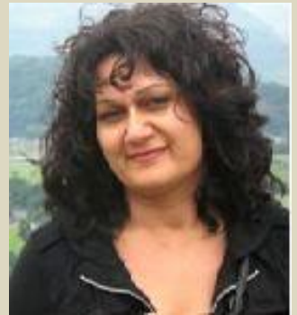
ناست و جۆرنک کارتیگردنی خویان هه‌یه؟

دهسه‌لاتداران له رنگه‌ی که‌لتوور و دابونه‌رتی کۆنه‌خواز و ژبانه‌وی دهسه‌لاتی دین بره‌و به هه‌لاوردنی ژن و پیاو ددها.