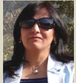
کار تيکردنی خویان هه يه؟

شهيدا معروف: نييهی ميينه هه ميشه گرتمان له گهل نيردگان هبه وک نه ووی بهرنيزت نامازت يی داوه، چونکه بهمانه ووی و نه مانه ووی پياوان ديپانده ووی ته نيا بؤ خویان بن نک بؤ نييه، هروا هه ميشه کؤش ده گهن که پاشگريان يين، نهو کيشانه له ميينه يه که و بؤ ميينه يه کی ديکه جياوازه، من وک خؤم تا نيستا تووشی گرقيکی لهو جوړه نه بؤمه که هينده زق بن و نه توانم کاری له سر به کم، چونکه کم تا زؤريک توانای چاره سرکردنم