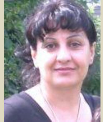
ناست و جوړیک کارتیکردنی خویان هه‌یه؟

حکومت نه‌ک ههر به‌رپرسياره له ژنکوژی به‌لکو تاوانباريشه، چونکه زوربه‌ی کوشتار و دستدرنژيبه‌کان له‌ژير نالای خویدا نه‌نجام ددریزن.