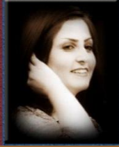
۱۵- خاتوو شەۋنەم ھەمزىيى