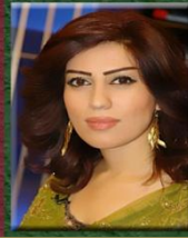
۲- خاتوو شلىر باپىرى