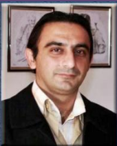
۱۲- بەرىز سامان قەقى نەبى