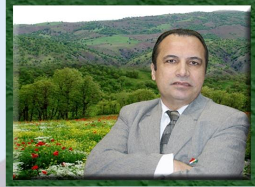
هه‌ر سه‌رکه‌وتوو بن. به‌ریزه‌وه ره‌حمان نه‌قشی

هه‌روه‌ها سیاس بو‌هه‌سه‌نگان‌دن و راو بو‌چوونی جو‌راوجۆر له‌ زمان کۆمه‌لیک ژن و پی‌او‌ی تیکۆشه‌ر که دا‌وایان لیکرا بو‌و له‌سه‌ر پرس و گیرو گرتنه هه‌نوکه‌یه‌کانی ژنانی کۆمه‌لی کوردواری زیاتر بدۆین و به‌شی کردنه‌وه‌ی لایه‌نی نه‌رینی و نه‌رینی خه‌باتی ژنان بو‌و ده‌سته‌پێنانی مافی یه‌کسانی له‌ گه‌ل پیاوان و هه‌ول‌دان بو‌ ژنیانیکی باشتر و گونجاوتر که له‌ گه‌ل هه‌ل و مه‌رجی نیستیای دینای پێشکه‌توو و کوردستان به‌گونجی. و هه‌روه‌ها نا‌واته‌خوازم نه‌ته‌وه‌که‌مان به‌ مافی دیاری کردنی چاره‌نووس، و دا‌بین کردنی کۆمه‌لگه‌یه‌کی به‌ دوور له‌ هه‌ر چه‌شنه چه‌وسانه‌وه و سه‌قامگیرکردنی نازادی و دی‌موکراسی که بیشک نه‌وه ده‌بیته هۆی دا‌بین کردنی نازادی ژن و به‌ختیاری کۆمه‌لگه‌ی گه‌لی کورده‌مان، به‌ هی‌وای نه‌و روژه. نی‌وه‌ش