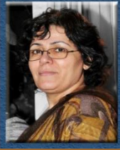
۱۴- خاتوو شوعەلە قادارى