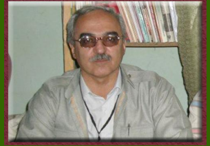
۵- بەرىز كەمان كەرىمى