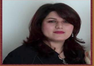
۱۳- خاتوو كوستان نىستانى