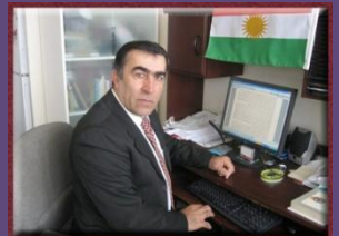
۹- بەرىز برايم جەھانگىرى