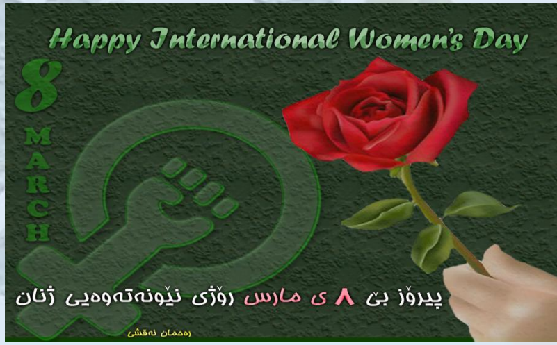
پىرۆز بى ۸ى مارس (ۋۆزى ئىپونەتەوھىى ژنان)

نابىن ژنان ئەوھشىان لە بىر بچن كە خەباتى ئەوان بە بىن ھاوكارى پىاوان ئەك ھەر بە ئاكام ئاكا بگرە ئاكامى پىچەوانەى دەبىن. بۇيە گىرىنگىرتىن كارى ژنان دەبىن ئەوھ بىن ھىزى بىن جىن ئەكەنە سەر پىاوان و ھەول ئەدەن ھەزاي تىوان ئەو دوو جىنسە گىزىر ئەوھى ھەيە بەكەن. ئەمەن پىم وا نىە بە تۆنەكردنەوھ بگرى خەباتىكى مافخاوانە بەرئۆھ بىردىرى يان سەرگەوئ. بەدەستەوھ دانى مافاى ھەنە لە "قىمىيىزىم" و پەيتا پەيتا دووپات كوردنەوھى ھىندىك دروشمى تونەد و تىيژ ناتوانى يارمەتيدەرى خەباتى ژنان بىن. كۆمەل لە دوو جىنىسى ژن و پىاوى پىنگ ھاوھ و بە بىن ھاوكارى و ھاوھەنگاوى ئەو دوو جىنسە كۆمەل نوقسانى ھەيە. كەوابوو نا بۇ بەردەوامى خەباتى ژن ھەتا وەدەست ھىنانى ھەموو مافەكانى. نا بۇ ھەرچەشە ھەولتىكى ئازاوكىرئانە و خۇ بە مېجورە دانانە. ھەياس كاردۆ- ئوستراىيا-