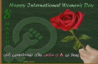
پېرۆز بى ۸ مارتى رۆژى ئۆيۈنمەتەۋەيى ژنان