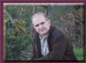
۱۱- بەرىز ھەياس كاردۆ