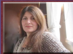
۱۰- خاتوو كوستان گادانى