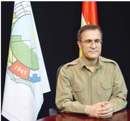
ته‌وه‌وعاتی میلییان زۆر تیدا بوایه، ئه‌وه‌سه‌لاتی ده‌وله‌تی ده‌گه‌ن که هه‌ست بکهن له چ مافیکی بێ به‌ره‌ بوون. له نه‌تیجه‌دا به‌دوای دا ده‌گه‌ڕێن و کاری بو ده‌گه‌ن تا به‌و شیوه‌یه‌دا شوێن بکهن و ئه‌و سێستیمان به‌رووخێن.

ده‌سه‌لات به‌ هه‌ددیک تێکه‌ل بوو که هه‌موویان به‌ یه‌که‌وه که‌وته به‌ر په‌لاماری کومه‌لاتی خه‌لک و له‌ رێژه‌ی ده‌وله‌تانی دنیا بکه‌ی ده‌کرێ بلیچن رۆژ له‌دوای رۆژ ژماره‌ی ئیستیداده‌کان که‌م ده‌بنه‌وه و له‌و ولاتانه‌دا دیموکراسی ئادهمه‌زۆری، مادام دیموکراسی ئادهمه‌زۆری، به‌دوای خۆیدا تبه‌یته‌ن نه‌ه‌ایدی ده‌بی و ده‌بی به‌ فه‌یه‌نگ. کاتێک دیموکراسی نه‌ه‌ایدی بوو، ئه‌و ئه‌زێشه له‌نێو ته‌یبه‌تانه‌ت و ته‌نانه‌ت هه‌ندی نسه‌ل له‌گه‌لی گه‌وره‌ ده‌بن. پێشوا‌یه ده‌ه‌یه‌تی ئه‌و پریسیانه‌ به‌شیکه له‌ ژبانی مرۆف. مادام ئیمه له‌و سه‌رده‌مه‌دا ده‌ژین که ژماره‌ی ده‌سه‌لاته دیکتاتور و ئیستیدادییه‌کان که‌م ده‌بیته‌وه و ژماره‌ی دیموکراسیخواه‌ه‌کان زیاتر ده‌بی و دیموکراسیخواه‌کان ئه‌و فه‌یه‌نگه له‌ کومه‌لیک‌ه‌کان دا نه‌ه‌ایدی ده‌گه‌ن، تبه‌یته‌ن له‌ دنیا ئه‌مه‌رو‌دا که هه‌موو شت بوته جیها‌نی، ئه‌وه‌ی که بێی ده‌لین گلوبالیزم. ئه‌و عه‌ظیته‌ت و بۆچوونه‌ش به‌ مه‌رحمه‌تی تیکنۆلۆژی میدیای له‌ دنیا دا بلۆ ده‌بیته‌وه، بۆیه ئه‌و خه‌لکانه که له ولاتانی دیکتاتۆری و ئیستیدادی دا ده‌ژین، به‌هۆی ئارادا بوونی کانه‌لانی ما‌هواره و ئه‌نتیتریت و کومه‌لیک که‌سه‌سی پێوه‌ندی، هه‌ست یه‌ ده‌گه‌ن که له بی‌مانیه‌کی یه‌کجار زۆرا ده‌ژین. بۆیه ئه‌وه‌ش ئیله‌میک ده‌دا به ئه‌وان و له هه‌مان کاتدا ها‌نیان ده‌دا که هه‌ست بکهن له چ مافیکی بێ به‌ره‌ بوون. له نه‌تیجه‌دا به‌دوای دا ده‌گه‌ڕێن و کاری بو ده‌گه‌ن تا به‌و شیوه‌یه‌دا شوێن بکهن و ئه‌و سێستیمان به‌رووخێن.