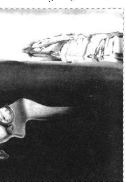
سالفادور دالى بەرەدوامىي حافظە (زاكە) ۱۹۳۱.

زۆر لەگەل ئەو نووسەران و ھونەرمەندانە كە بەرەو سورىئاليزم چووبوون، پىتەندىي گرت. بەلام مېرۆ لەسالىدا، ئىدى شىتوئەي تايبەت بەخۇي پىكەپىتابو و پەرى پىتابو. ئەو تەنبا ژمارەكەي كەم لە تۆجەكانەي سورىئاللىستىي لە ۋىتەكانىدا كۆنجانە. لاىەنى سورىئاللىستىي بەرھەمەكانى مېرۆ بەباشترىن شىتوئە لە ھىندىكە لەكارە سى رەھەندىيە سەسورھىنەردەكانىدا كە پىتەندىيان بە دەبىي ۱۹۳۰بەھەمەيە و، ھەرۋەھە كە ژمارەيەك بەرھەمەكانى كە ئەركىكى سەمبولىكىيان ھەيە، خۇي دەرخستەو. شىتوئەي ھونەرىي مېرۆ پرە لە نىشانەكان و،