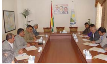
سهردانی حیزب دیمۆکراتی کوردستان له نۆویژ بهرز راگیرا. سهردانی حیزب دیمۆکراتی کوردستان له نۆویژ بهرز راگیرا.

سهردانی حیزب دیمۆکراتی کوردستان له نۆویژ بهرز راگیرا. سهردانی حیزب دیمۆکراتی کوردستان له نۆویژ بهرز راگیرا. سهردانی حیزب دیمۆکراتی کوردستان له نۆویژ بهرز راگیرا.