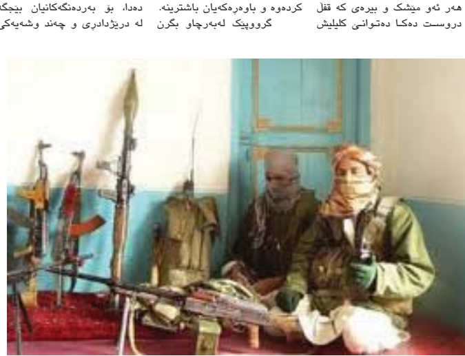
ساز بکا، واقعیەتی میژوویی ئەو درەخا کە رەوتی کەشەسەندی دەردەخا کە بە پێشکەوتن، پیگەپەشتن، گەشەکردن و پەرسەندنی سیستەم ئەمنییەتیەکان دەرمان ناکری چونکە یەکە ئەووەک ئیشتان بەبەرگی ناسین و پۆلابین خۆقیترۆو و دووھەم ئەووەک هەر ئەو مێشک و بیرە کە قفل دروست دەکا دەتوانی کلیلیش

هەلسەنگەکانی تیرۆرێزم ئامانجخوایێ دوروور لە دەست پێراگەپەشتن بە پێکەینانی شارێ خەپالی(یوتوپیا)، هەست کردن بە بیزاری و پەرەپێتان و پلاوکردنەو لە ناو هاورێزان، خۆپاراستن لە پەشیمانی بە هۆی چەقیەستویی، ویناکردنی چەشەنی وەرچەرخان لە میژوو، هەست کردن بە بێبەشیەکی رێزویی و... لە هۆکارە شنارەو و بەبەرمی کردنی توندوتیژی باوەری ئەو کەسانە کە لە تیرۆرەکاندا بەشار دەبن، ئامانجگەلی گۆرە لە پشت کردووە روالەتیەکانیاندا شاردارەوتە کە بۆ گەشتن پێیان ئەوای دەسکوتەکانی مرفاقیەتی یان بەشتیک لە درووشم و ئاگەکانیان.. دەبی بخریتە ژێر پرسیار یان گۆرانی بەسەردا، ئەم جۆرە تیگەپەشتانە ریکە دەدا هەتا نادەرییەکانی کەسانی دیکە لە دایکرینی رێزویی حەقانییەتی ئەم چەشنە بزانەکانی بێتە جێگە یاس، ئامانج سەرەوئێکردنی یاساکان و رێزویی دەسلتارە کە دەتوانن بە سەرنجندان بە بەرلابویی کردووەکان خۆمالی، ناوچەیی یان بان ناوچەیی بن بەلام کەمتر هەول دەدەری هەتا لە بەرژووەندی رێژیمدا ئالترناتیویک دیاری بکری. «کلابین» لەو کەسانە کە لە هەیش بۆ سەر بکەن دایمیی ریکخراوی ئۆپیک لە وییان پێختی لاتوی ئوتریش مەبەستی هەڵبڕداری بازە کەس لە وەزیرەکانی ئەوتدا دەستی هەبۆ، ناوبرا دەلی: « ئەو روواداوەسی کە لە سالی ۱۹۷۲ دا لە فرانکورت روویان دا و ئەو خەباتی کە لە هایدلیز بە مەبەستی نارەزایەتی بە شەری ویتام و ئەمریکا دەستی پیکرد، بە چوونی من لەو سەرەدا تەنیا ریکای واقعی خەباتی سیاسی بکری بۆ ئەوەی پلانی تیرۆرێست بۆ کردووەکە دابین بکری، بەلام ئەم پیشگی و خۆتامادەکردنە