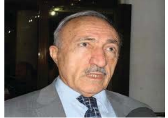
یه‌کێک له‌ پارلامنتاری سهر به‌ لیستی هاو‌به‌یانی کوردستانی رایگه‌یانده‌ که ده‌وله‌ته‌که‌ی مالیکه‌ به‌رگه‌ی ئهم هه‌موو گرتو کیشه و قه‌یرانه‌ی ئیستا ناگره‌ی و به‌ هه‌ی زیادبوون و که‌له‌که‌بوونی ناکیکیه‌

سیاسیه‌یکان به‌م زووانه‌ هه‌ل ده‌وشه‌توه‌.