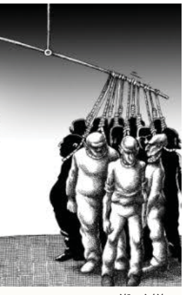
مانا نیستانی، دیموکراسی یانی .... حق به‌ زۆریه‌یه‌، لیکدانه‌وه‌ی ئیوه‌ جیه‌